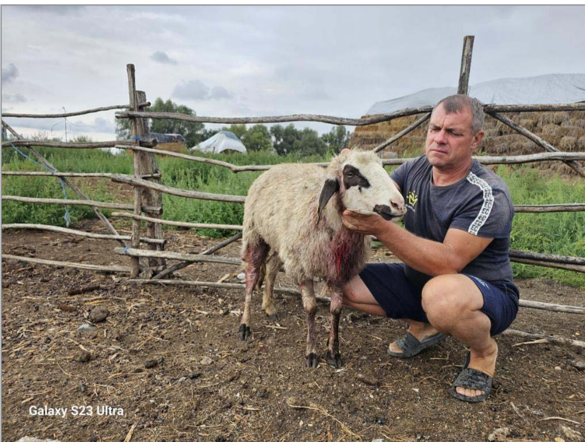
Galaxy S23 Ultra

sia de evaluare a pagubelor. Cadavrele animalelor vor fi neutralizate prin îngropare pentru a elimina orice risc de răspândire a vreunei boli.