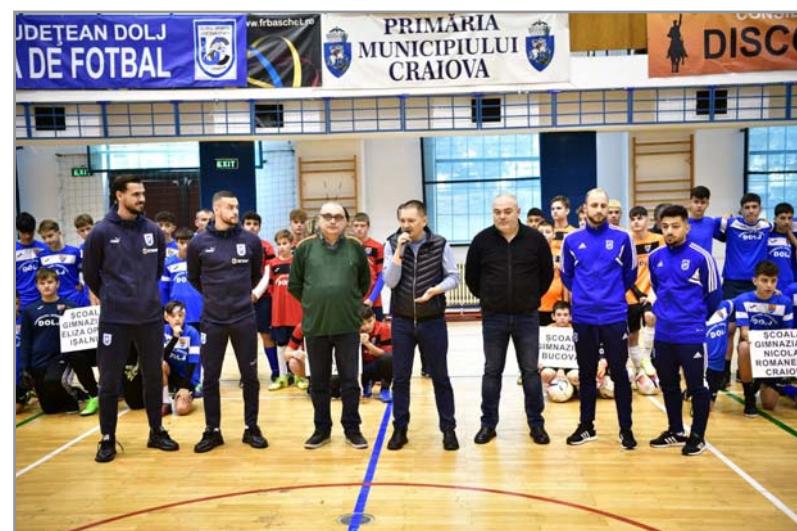
Liceul Teoretic „Gheorghe Vasile” Cetate și Școala Gimnazială „Eliza Opran” Ișalnița.

Șase echipe de la unități de învățământ din Dolj au disputat, sâmbătă, faza finală a „Olimpiadei de fotbal”: Școala Gimnazială „Nicolae Romanescu” Craiova, care a câștigat competiția, Școala Gimnazială Cerăt (ocupanta poziției a doua), Școala Gimnazială Bucovăț și Școala Nr. 1 Dăbuleni (ambele clasate pe locul al treilea),