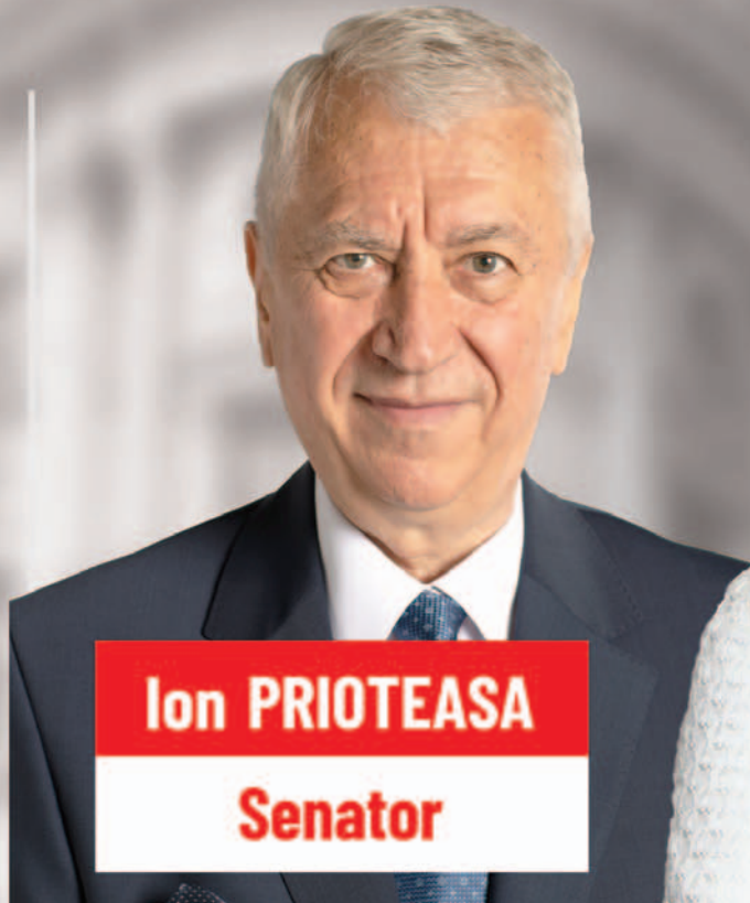
Ion PRIOTEASA Senator