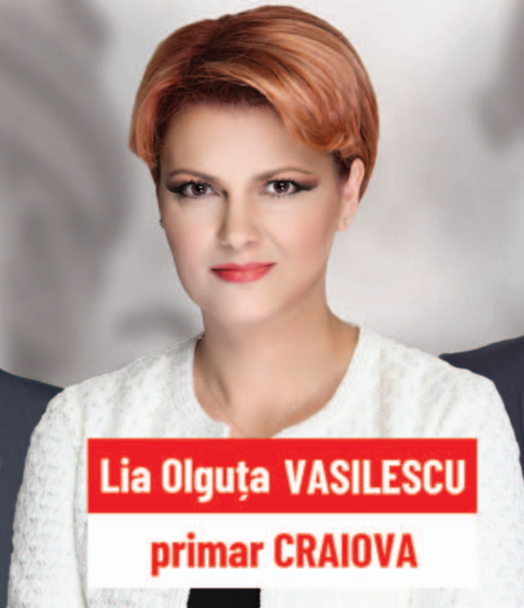
Lia Olguța VASILESCU primar CRAIOVA