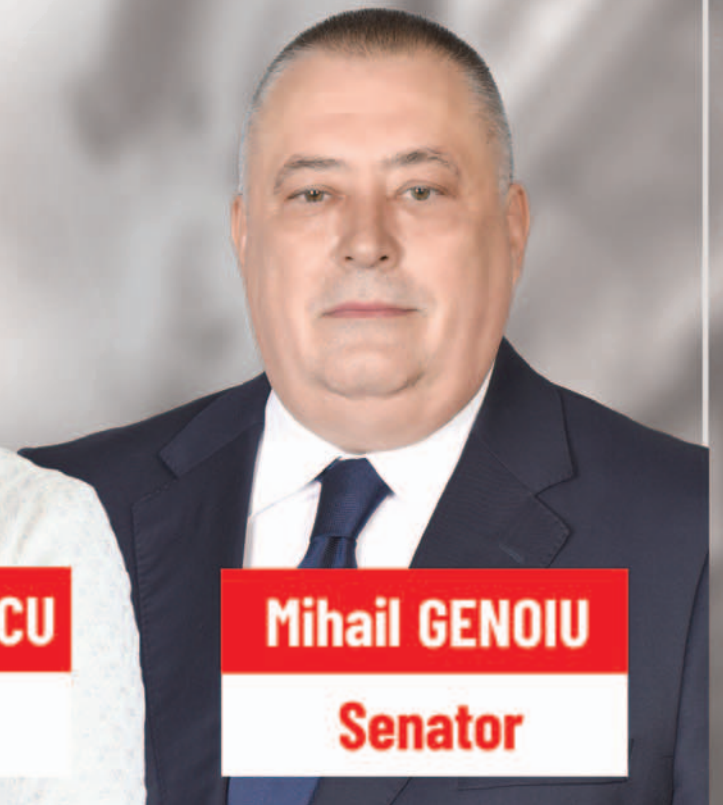
Mihail GENOIU Senator

Comandat de Partidul Social Democrat Organizația Județeană Dolj, tipărit de SC EDIPRESS SRL, CUI mandatar 11200020