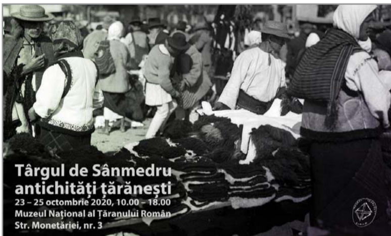
Târgul de Sânmedru antichități țărănești 23 - 25 octombrie 2020, 10.00 - 18.00 Muzeul Național al Țăranului Român Str. Monetăriei, nr. 3

prăjituri, turtă dulce, cozonaci și miere, dar și bragă sau țuică. Nu vor lipsi nici plantele de leac sau ghivecele cu flori.