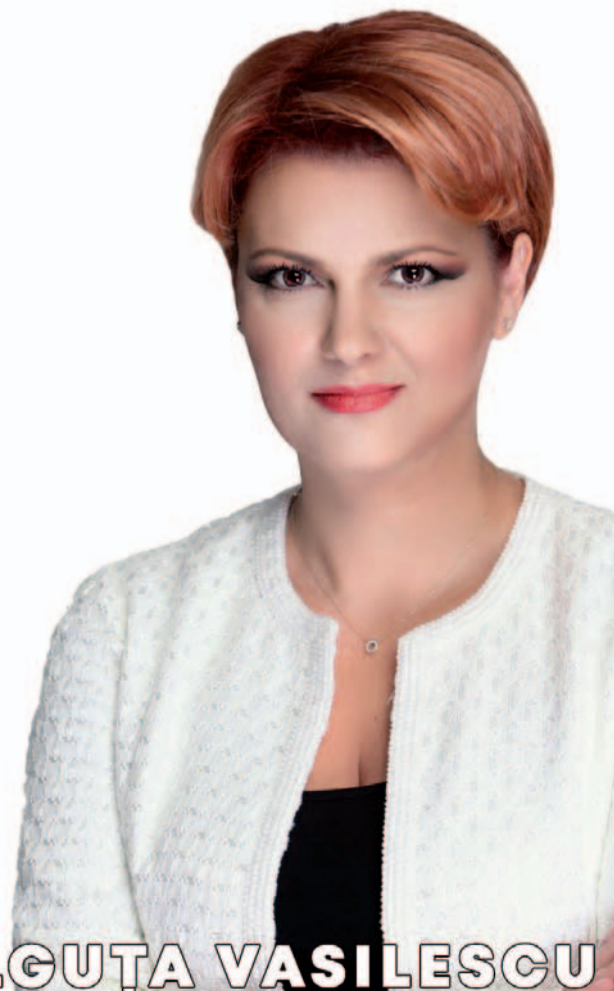
LIA OLGUȚA VASILESCU