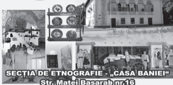
SECȚIA DE ETNOGRAFIE - „CASA BANIEI” Str. Matei Basarab nr.16