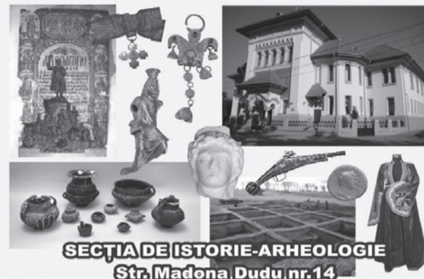
SECȚIA DE ISTORIE-ARHEOLOGIE Str. Madona Dudu nr.14