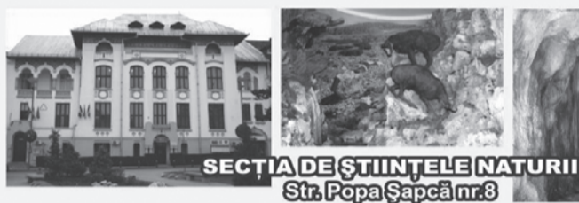
SECȚIA DE ȘTIINȚELE NATURII Str. Popa Șapcă nr.8