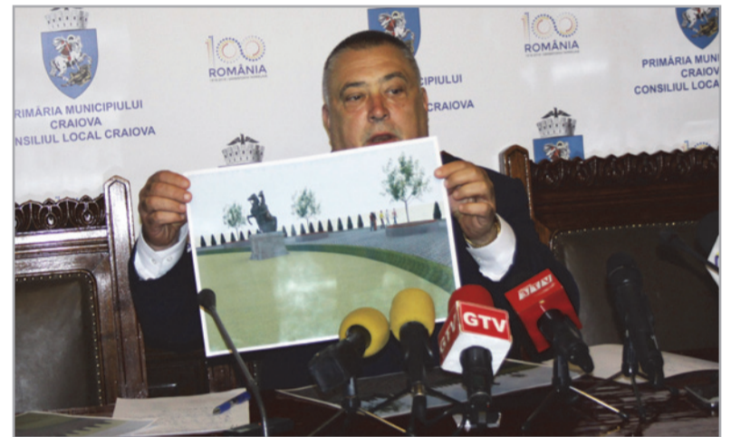
„Primul pas spre un oraș smart city”

urbanistic a primăriei. Autoritățile locale intenționează să includă pe platformă și strategia de dezvoltare a orașului, astfel încât extinderea municipiului – care se dorește a se face în special în partea de nord – să se poată face într-un mod organizat.