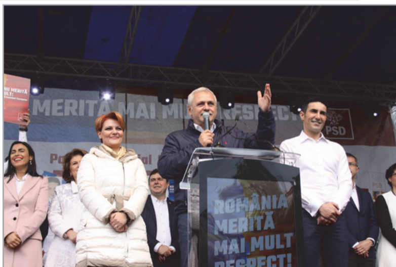
Dragnea...va candida la prezidențiale

Senatorul Claudiu Manda, locul 3 pe lista PSD la alegerile europarlamentare a fost gazda evenimentului electoral de la Craiova. Acesta a dat câteva exemple de proiecte pentru care se fac demersuri susținute, drumul expres Craiova – Pitești fiind unul dintre ele. „Avem aici, peste 40.000 de doljeni să spunem într-o singură voce, da pentru o Românie puternică în Europa. Da pentru români demni și patrioți în Europa... Nu ne vom opri până nu vom vedea înfăptuit drumul expres Craiova-Pitești. În 2013 au venit aici Ponta și Șova, au spus că ne fac autostradă. Ne-au mințit. Liberalii portocalii au avut trei miniștri din Dolj, nu au făcut nimic. Guvernul nostru va face drumul expres”, a mai afirmat senatorul PSD. Vicepreședintele Senatului, Claudiu Manda l-a criticat și pe Dacian Cioloș. „Ne critică Cioloș și ai lui că nu atragem fonduri europene, îmi place și repet. Ne critică Cioloș și chichirăii lui că nu atragem fonduri europene. Am preluat guvernarea de la ei cu zero fonduri europene, și-au bătut joc de fermieri”, a mai declarat Claudiu Manda.