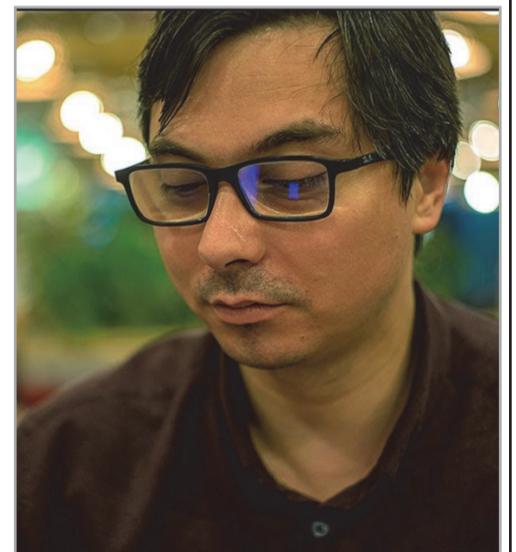
God in Moldavian Mural Decorations, în Revue des Etudes Sud-Est Européennes XLIX (2011), „The Elijah Cycle at Neamț” ( Revue Roumaine d'Histoire de l'Art, série Beaux Arts ).

mai multor așezăminte religioase de pe teritoriul României. Din studiile publicate: „Mănăstirile Olteniei. Artă și spiritualitate” (coautor), „Repertoriul picturii murale brâncovenesti. I Județul Vâlcea” / Editura UNArte, București, 2008 (coautor), „În pragul sanctuarului. Iconografia spațiului de trecere spre absida altarului în ansambluri medievale moldovenești”, „Selecția sfinților ierarhi în absidele moldovenești (secolele XV–XVI)”, „The monk, equal to the martyrs? Moldavian iconographic instances”, „The Cosmic Liturgy and its Iconographic Reflections in Moldavian Late Medieval Images, Materialités et immaterialités de l'église au Moyen-Age”, „The Lamb of