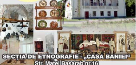
SECȚIA DE ETNOGRAFIE - „CASA BANIEI“ Str. Matei Basarab nr.16