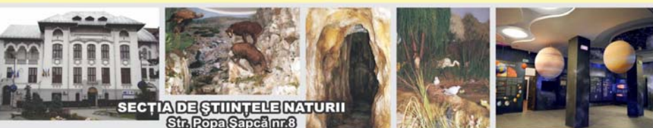
SECȚIA DE ȘTIINȚELE NATURII Str. Popa Șapcă nr.8

Contact: Str. Popa Șapcă nr.8 • Tel.: 0251-417.756 • muzeulolteniei@yahoo.com • www.muzeulolteniei.ro