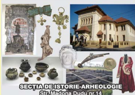
SECȚIA DE ISTORIE-ARHEOLOGIE Str. Madona Duda nr.14