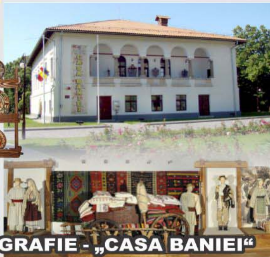
SECȚIA DE ETNOGRAFIE - „CASA BANIEI“ Str. Matei Basarab nr.16