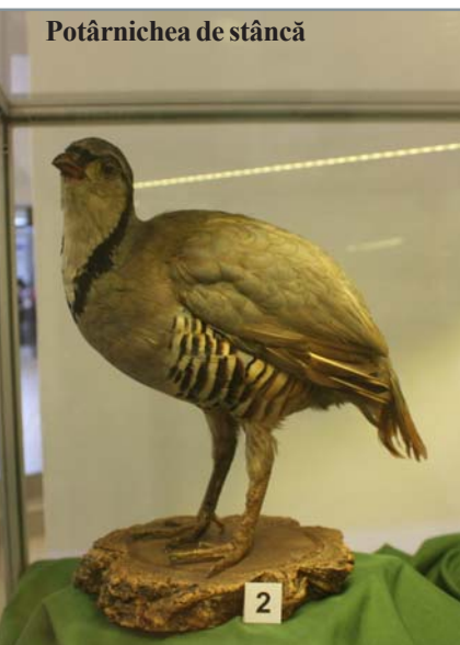
Potârnichea de stâncă

Cele mai multe piese din cadrul expoziției fac parte din categoria Fond a patrimoniului național, iar două – singurele, de altfel, pe care