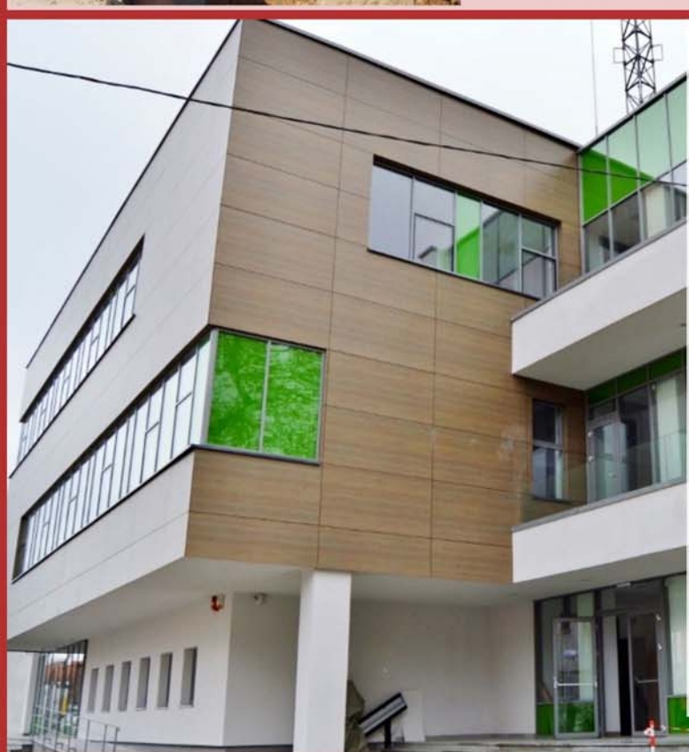
Centrul de coordonare a intervențiilor