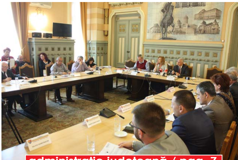
administrație județeană / pag. 7

Ședință extraordinară, ieri, la Consiliul Județean Dolj. Cinci proiecte s-au aflat pe ordinea de zi și toate au reprezentat o urgență. Marți, 24 mai, la București, la Ministerul Dezvoltării Regionale, se va lua proiect cu proiect și se va analiza stadiul implementării, suma accesată și impactul investiției în regiune. Ulterior se va trimite bilanțul la Bruxelles, la Comisia Europeană, unde se vor face corecțiile financiare.