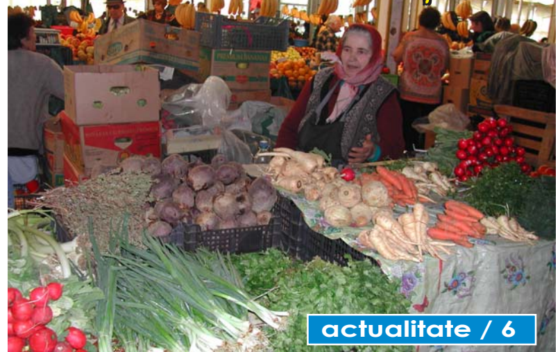
actualitate / 6