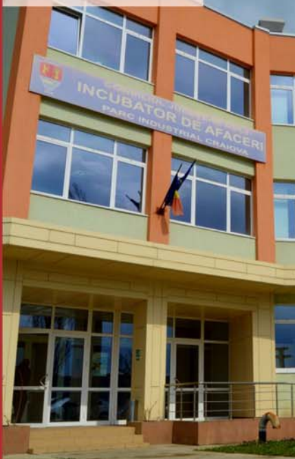
Parcul Industrial Craiova