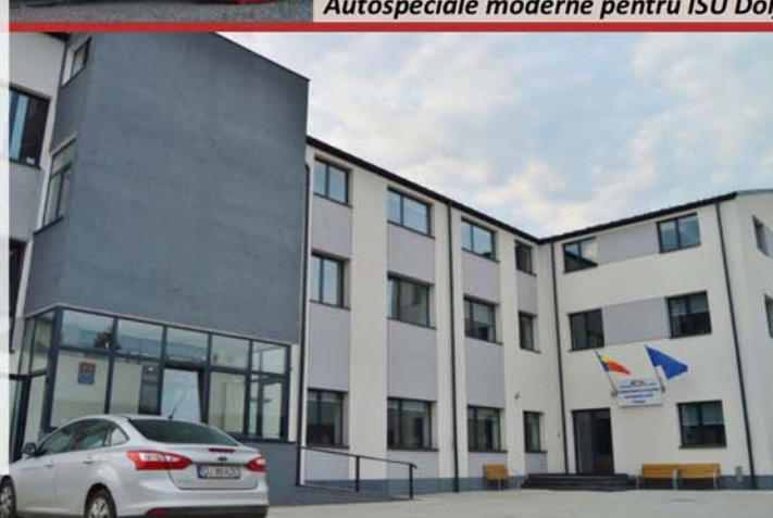
Centrul de pregătire pentru protecția civilă