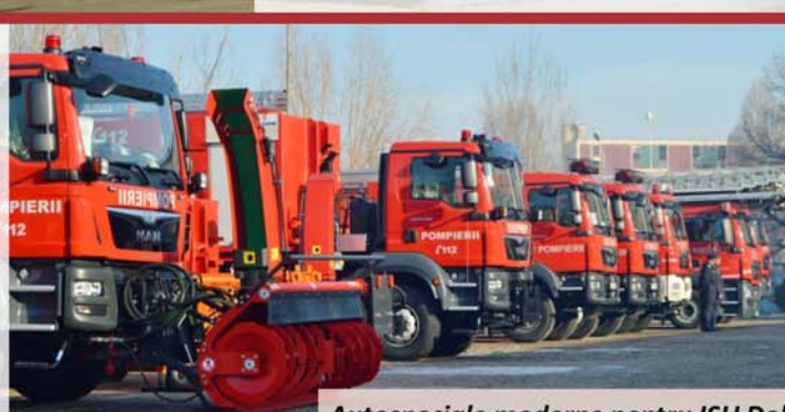
Autospeciale moderne pentru ISU Dolj