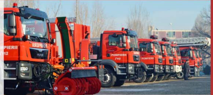
Autospeciale moderne pentru ISU Dolj