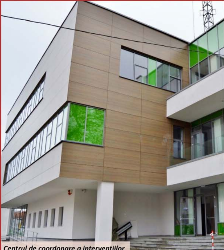
Centrul de coordonare a intervențiilor