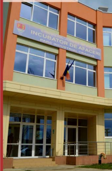
Parcul Industrial Craiova