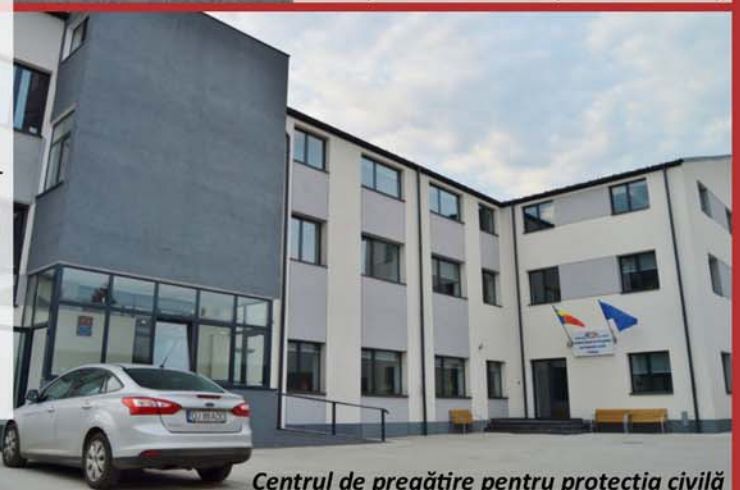
Centrul de pregătire pentru protecția civilă