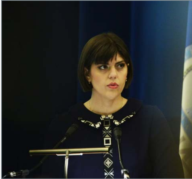
Există vulnerabilități care pun în pericol buna funcționare a societății și o corupție generalizată în domeniul achizițiilor publice, a declarat pro-

Kovesi: valoarea mitei în dosarele de corupție este de 431 milioane euro