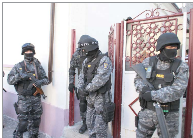
lității Economice – Inspectoratul de Poliție Județean Mehedinți, sub supravegherea Parchetului de pe

Acțiunea, care a beneficiat de suportul de specialitate al Serviciului Român de Informații, s-a desfășurat în cadrul unui dosar penal aflat în instrumentarea Serviciului de Investigare a Crimina-