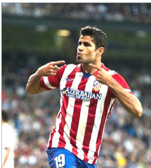
Rooney nu au ajuns, în cele din urmă, la gruparea londoneză.

Arsenal a încercat să aducă un nume mare și vara trecută, dar Luis Suarez, Gonzalo Higuain, Stevan Jovetici sau Wayne