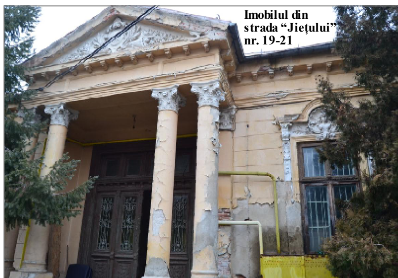
Imobilul din strada „Jiețului” nr. 19-21

Acesta a apreciat existența Programului de Cooperare Transfrontalieră România – Bulgaria 2007-2013, „care dă posibilitatea finanțării unor proiecte ale celor două comunități cu fonduri europene”, dar a subliniat totodată că „viitorul exercițiu financiar al Uniunii Europene, 2014-2020, care prevede o componentă privind cooperarea transfrontalieră româno-bulgară, trebuie fo-