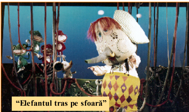
“Elefantul tras pe sfoară”