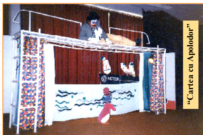
“Cartea cu Apolodor”