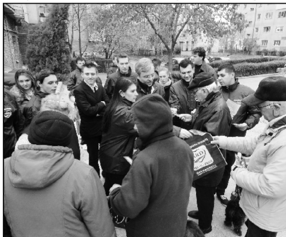
Candidații ARD și-au făcut timp pentru fiecare alegător

Deși dezamăgiți de lumea politică, cetățenii cartierului Rovine au promis că vor vota INIMA, cu speranța că în sfârșit Craiova va redeveni unul dintre motoarele economiei românești și europene.