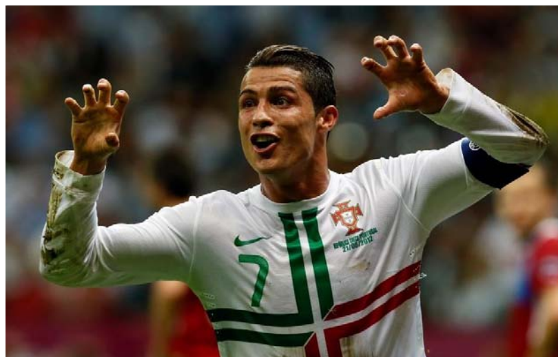
Cristiano Ronaldo (foto dreapta) și Andres Iniesta (foto stânga) ar putea fi principalii actori în această seară. Cine va zâmbi la sfârșit, rămâne de văzut!

Iată o comparație între cele două reprezentative conform datelor de la Euro: