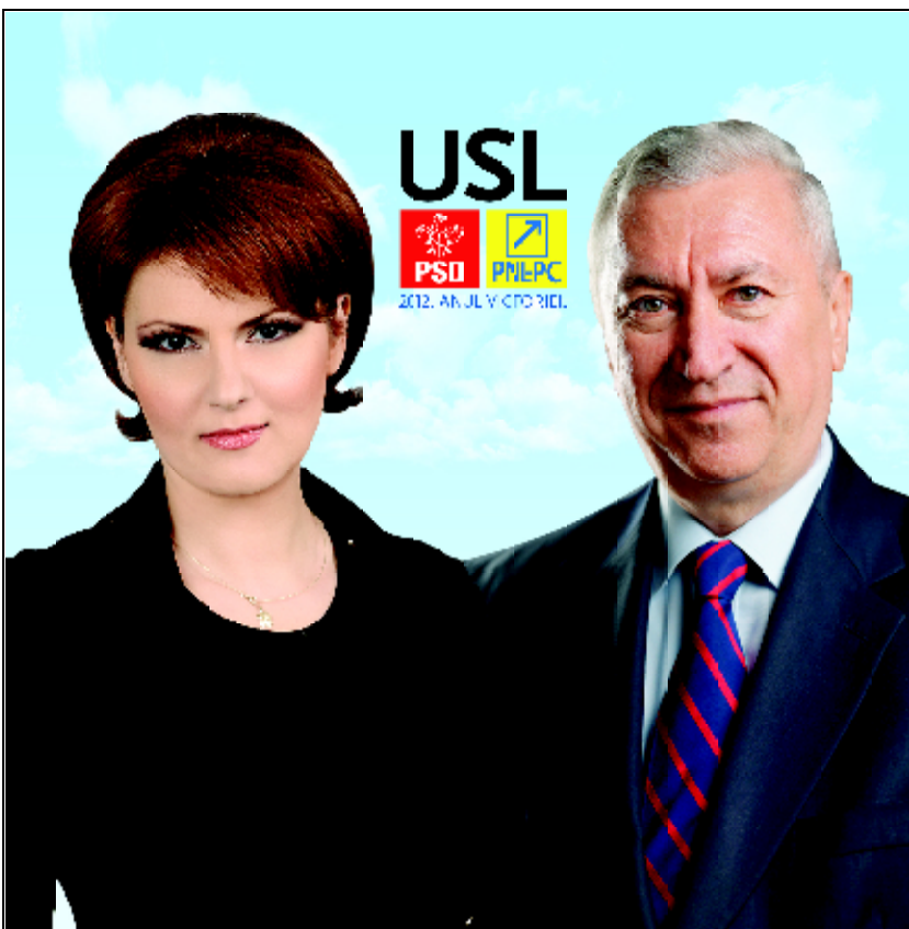
LIA OLGUȚA VASILESCU PRIMAR PENTRU CRAIOVA