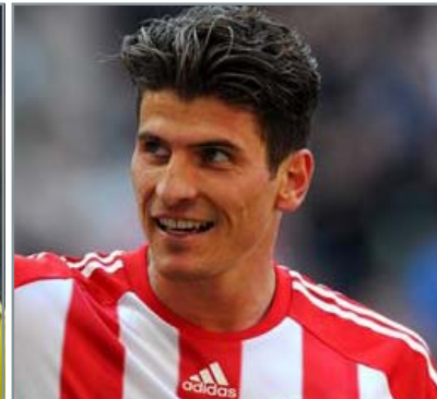
Ei sunt principalii realizatori ai celor două echipe în Bundesliga: Robert Lewandowski (19 goluri – foto stânga) și Mario Gomez (25 de goluri – foto dreapta)