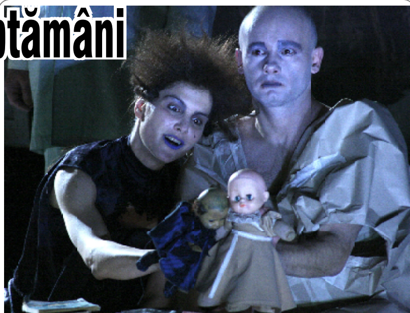
„O furtună” (Teatrul Național „Marin Sorescu”, Craiova)