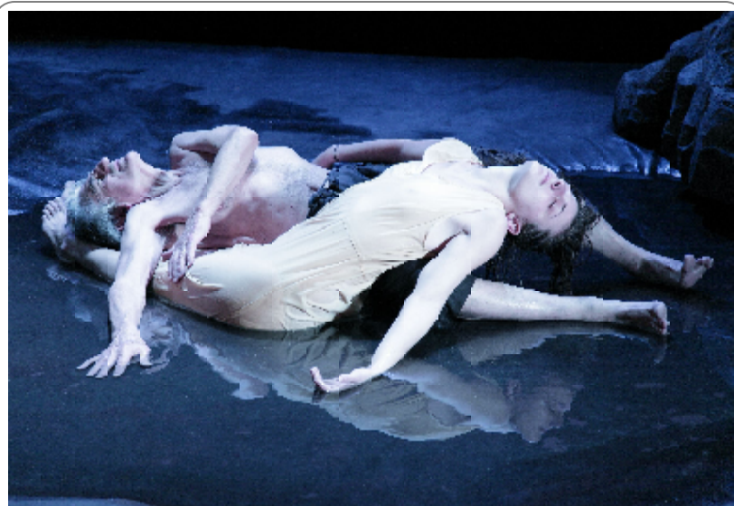
„Regele Lear” (Compania „Scene en vie”, Grenoble)

fus Wainwright. Ediția de la Craiova se va derula până pe data de 1 mai, într-un regal de spectacole străine și românești, în timp ce în Capitală spectacolele vor fi prezentate în perioada 30 aprilie – 12 iulie. Tema din acest an este „Lumea-i un teatru, noi suntem actorii”.