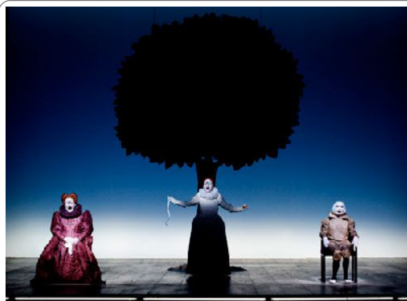
„Shakespeare's Sonnets” („Berliner Ensemble”, Berlin)

Găsiți programul complet al evenimentului pe site-ul Teatrului Național „Marin Sorescu” – www.tncms.ro . De asemenea, găsiți deja la vânzare bilete și abonamente pentru spectacole la Agenția aceeași instituții (tel. 0251.413.677).